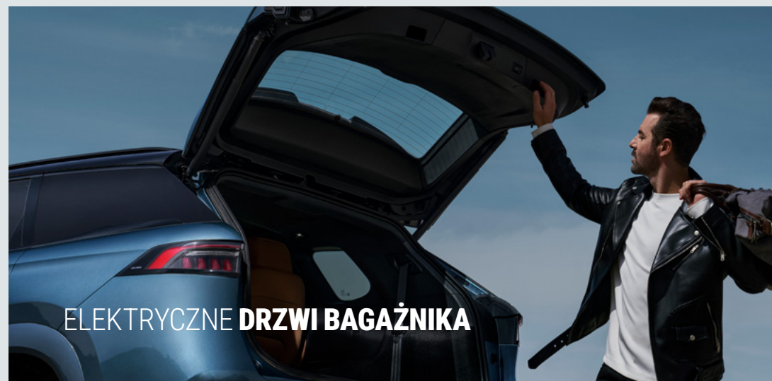
ELEKTRYCZNE DRZWI BAGAŻNIKA