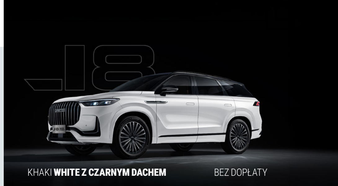
KHAKI WHITE Z CZARNYM DACHEM