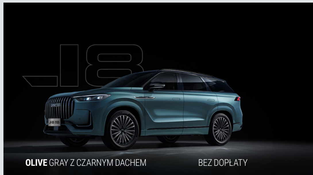
OLIVE GRAY Z CZARNYM DACHEM