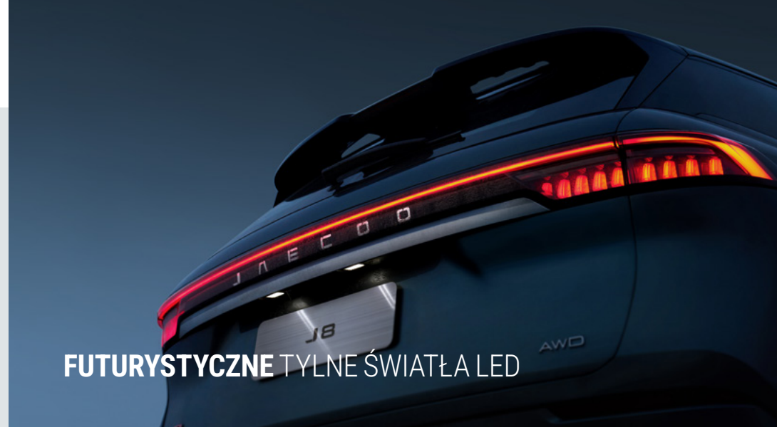
FUTURYSTYCZNE TYLNE ŚWIATŁA LED