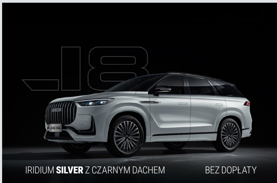
IRIDIUM SILVER Z CZARNYM DACHEM